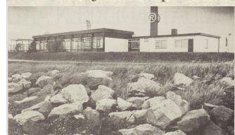
GEEN GEVOLGEN VOOR PERSONEEL

...ijeenkomst werd bezocht door ruim 120 vertegenwoordigers uit het MKB en vond plaats in restaurant 'Grevelingen'.